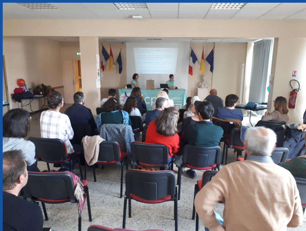
Aix en Provence