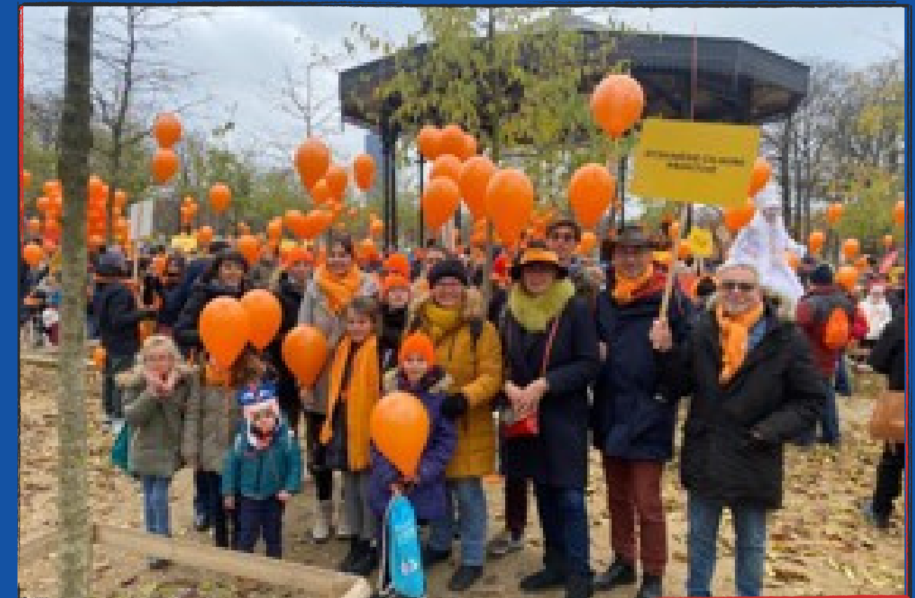
La Marche des Maladies Rares