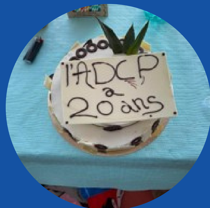
Rencontre nationale de Lyon