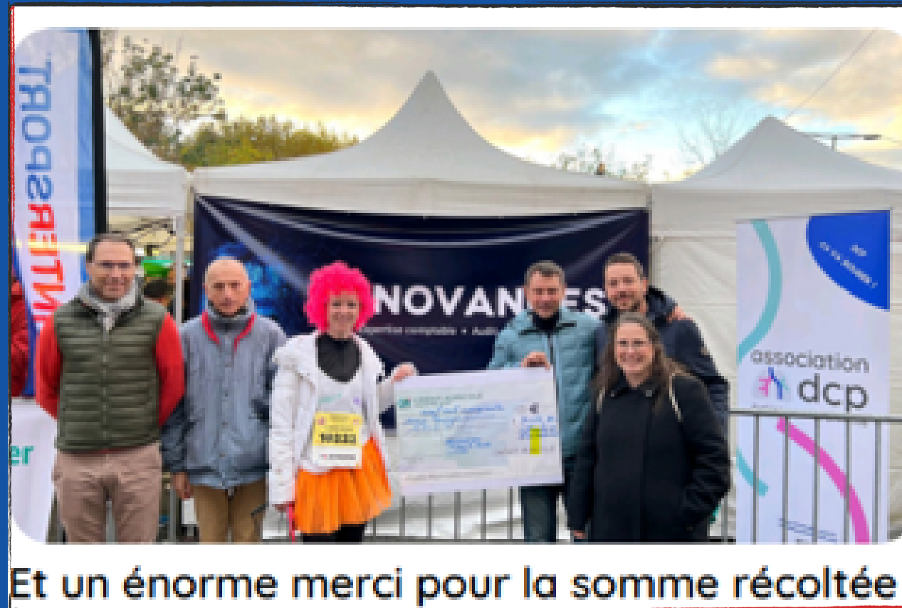
Et un énorme merci pour la somme récoltée