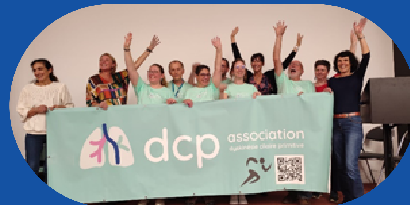
Le nouveau CA