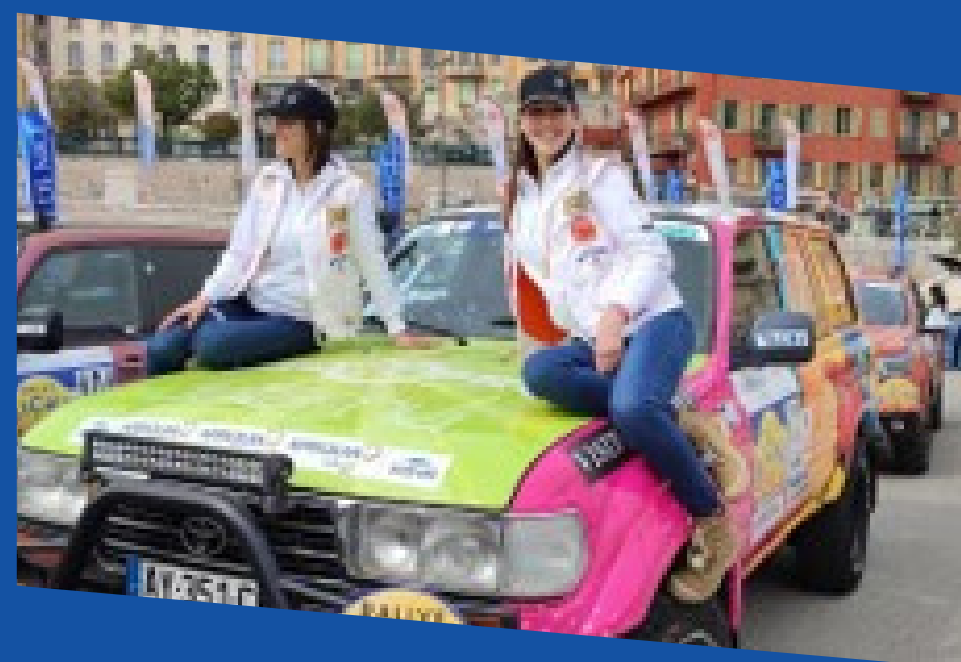
Rallye des Gazelles